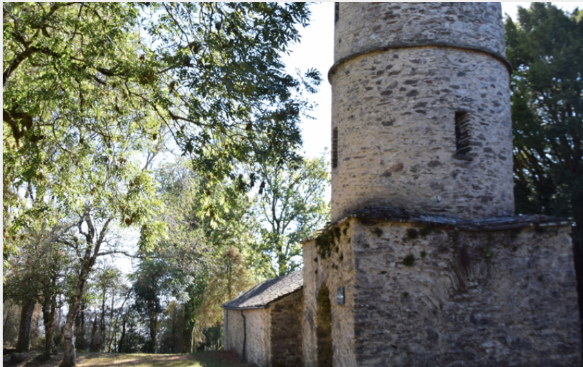
chapelle carolingienne de St Jean del Frech - Lacaze