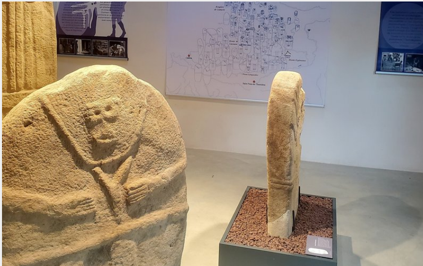
Crédit : Statues menhirs de Miolles_Miolles (Route des statues menhirs d'Occitanie)