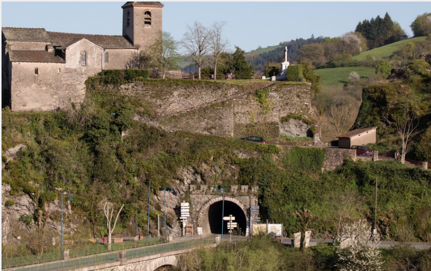
Crédit : Notre Dame de la Capelle à Ambialet