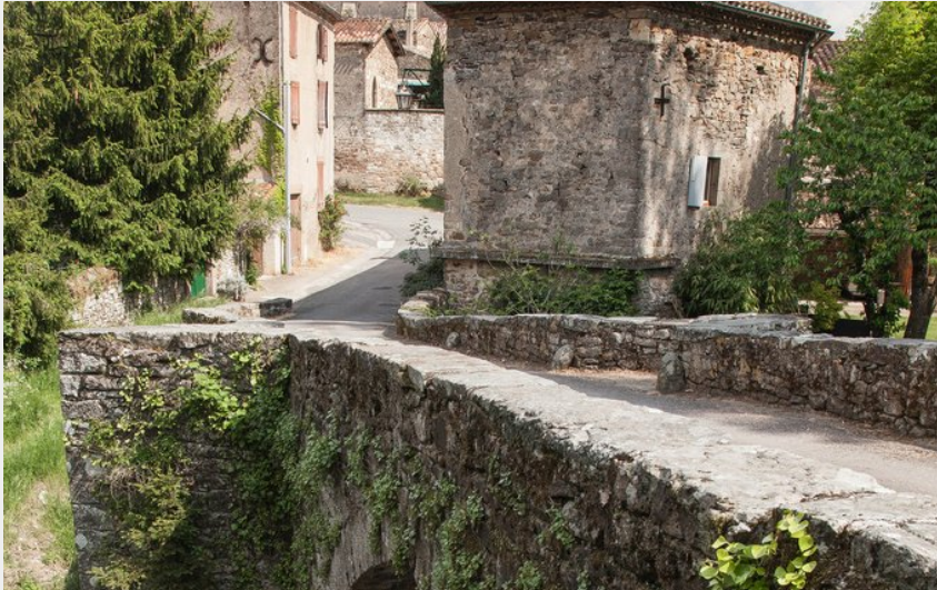
Crédit : Le pont de Candèze du 13ème s.