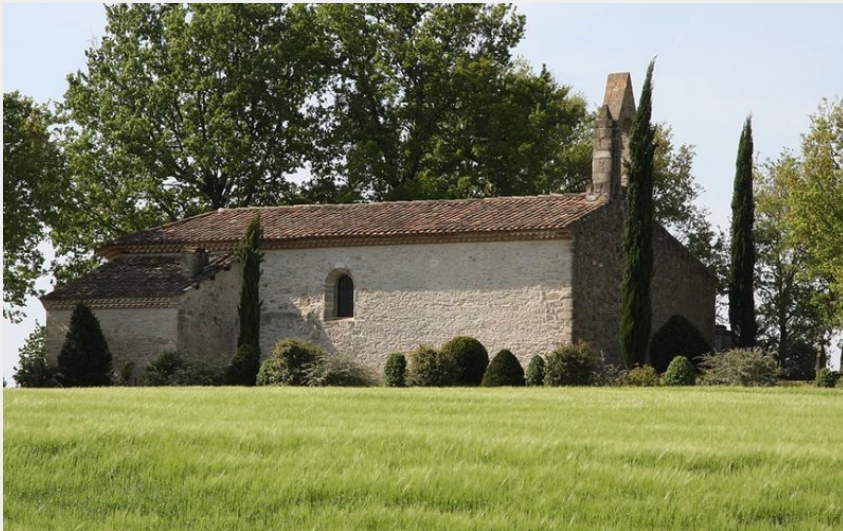
Crédit photo : Ste Cécile de Plane Sylve (Mairie de St-Paul-Cap-de-Joux)