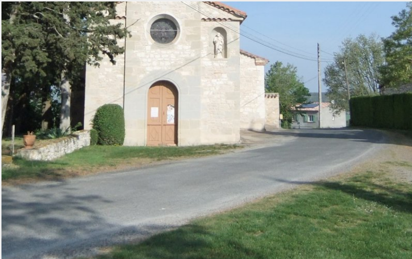
Crédit photo : Eglise de St-Julien du Puy (Mairie de St-Julien du Puy)