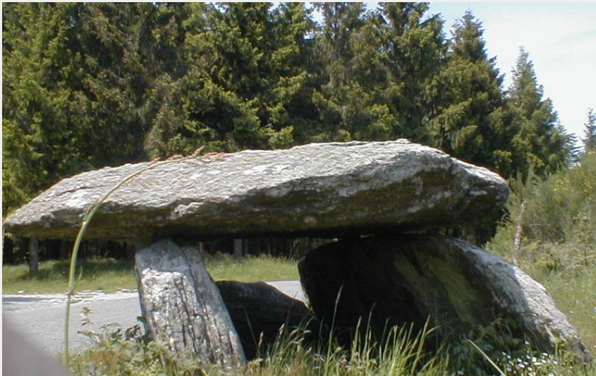
Crédit : dolmen de la gante labastide rx