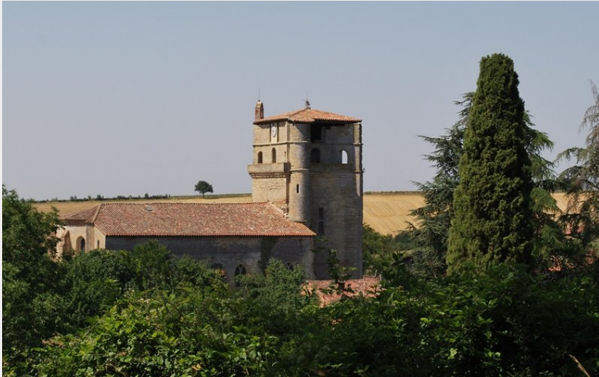
Crédit photo : vue église de Belcastel (OTI-TA - église de Belcastel)