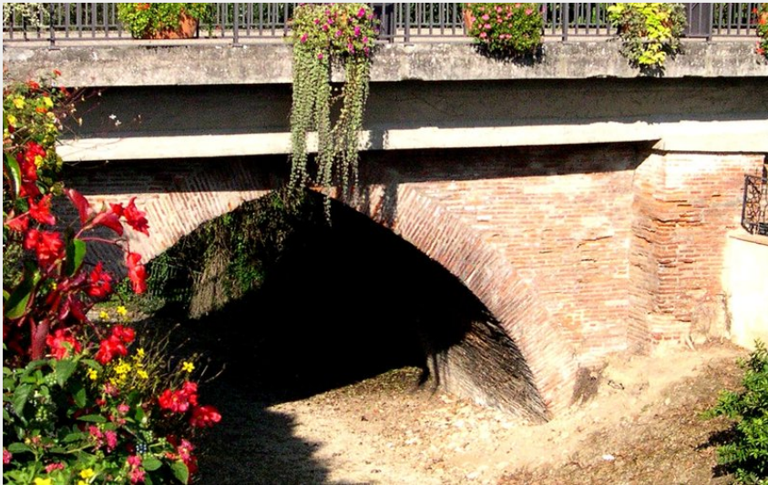
Crédit : pont de la rustan (B.Bernardin - Mairie de Saint-Sulpice-la-pointe)