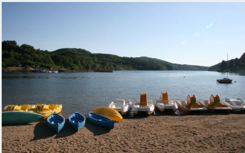
Lac du Laouzas, sur la commune de Nages