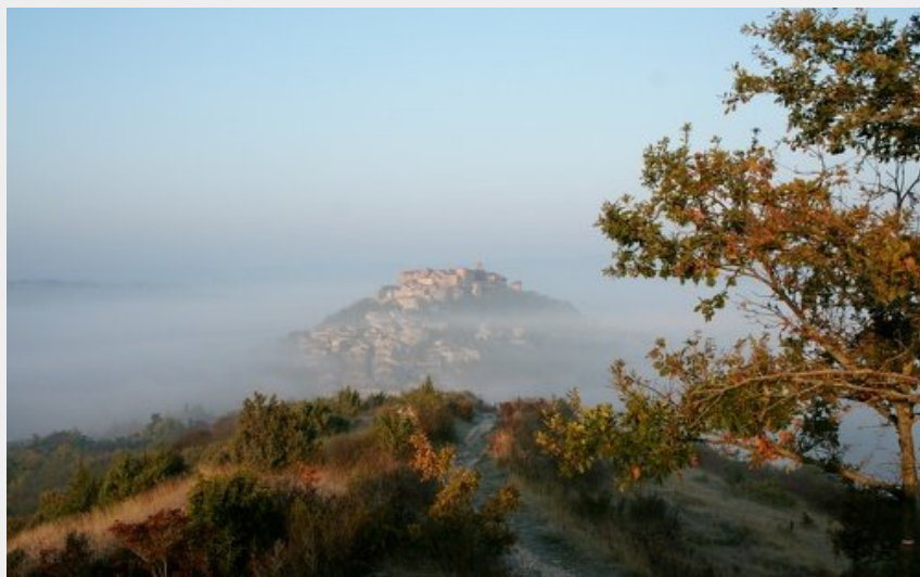
Crédit : Cordes sur Ciel sous la brume 12