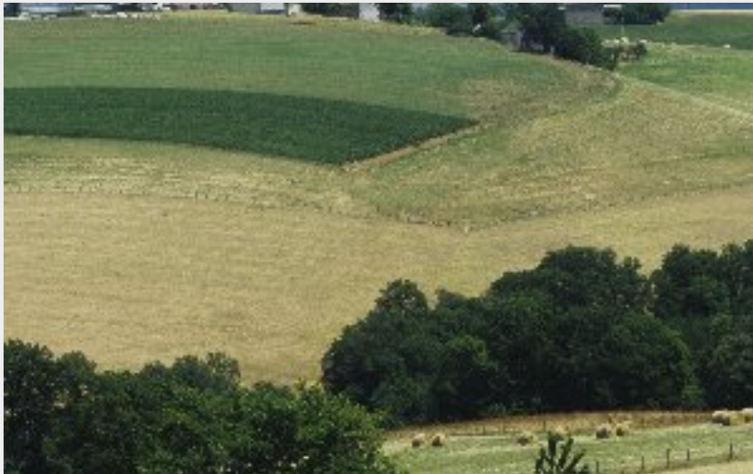
Crédit : Vue sur le Ségala champs