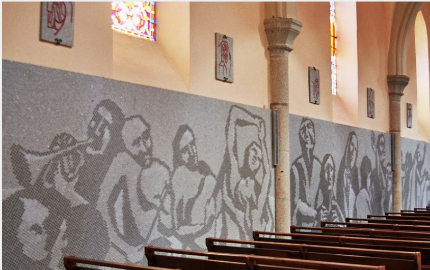
Crédit photo : Eglise de Lacrouzette (Office de tourisme du Sidobre Vals et plateaux)