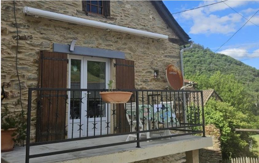
Crédit : La Tourrette - Saint-André - Gîtes de France Sud (Gîtes de France)