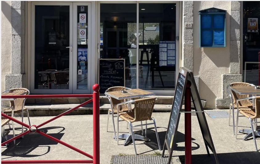
Façade l'établissement