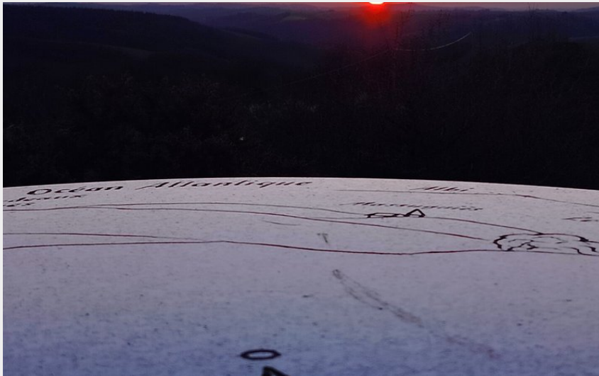
Crédit photo : Coucher de soleil depuis la table d'orientation (Antoine Leblic)