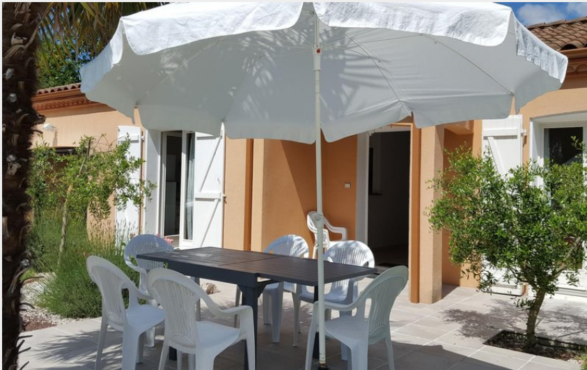
Crédit photo : Chemin bas ouest - Gaillac - Gîtes de France - terrasse (Gîtes de France)