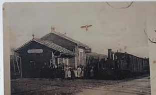
Un panneau retrace ici l'histoire du Petit Train