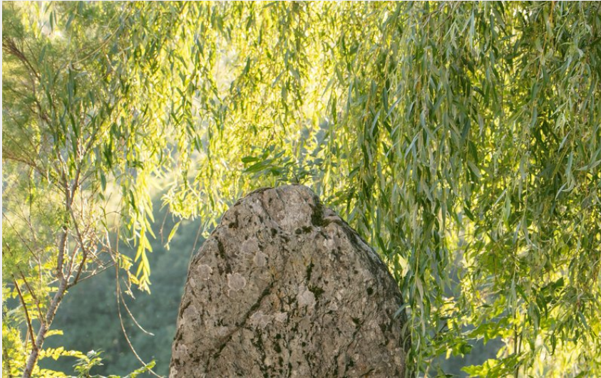
Crédit : Face principale de la statue-menhir (Margaux Ricard photographe - HTO)