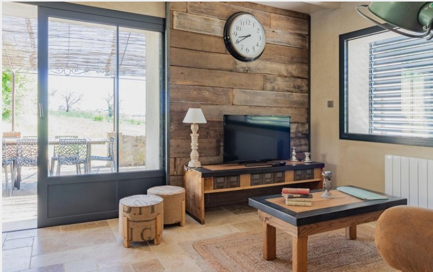
Séjour avec baie coulissante donnant sur la terrasse ombragée