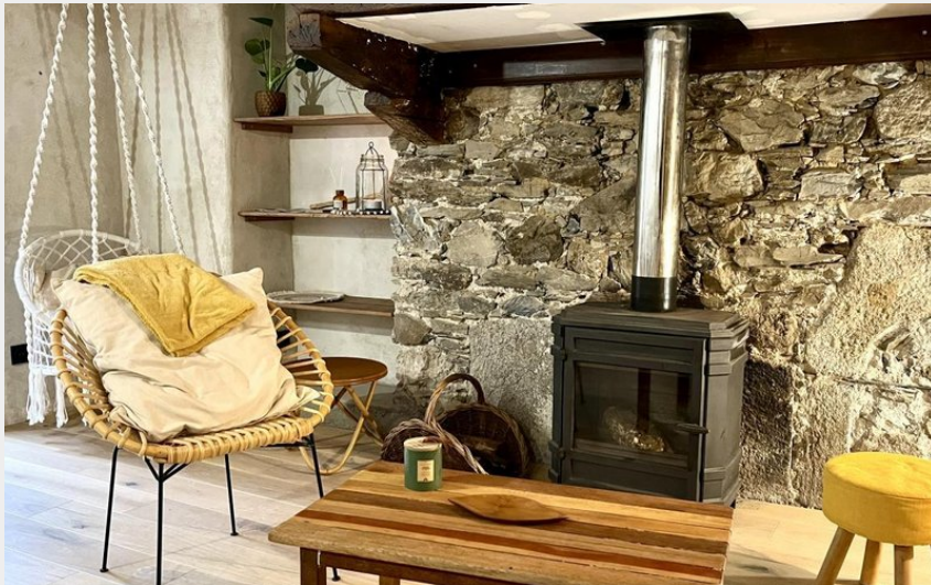
Crédit : Canopée, G1932 Gîtes de France - Le Bez, Tarn ©E ( Gîtes de France)