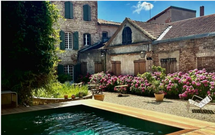
Vue de la piscine sur la cour intérieure