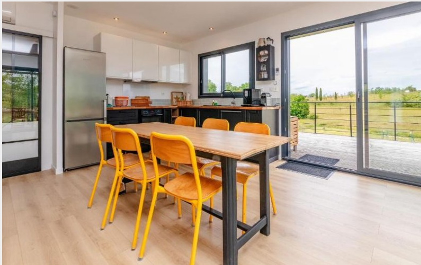
Crédit : Maison Verte Vigne - Vue sur les vignes - Ecologique 1 (Raynaud photo)