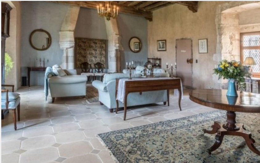
Château de Brametourte_Lautrec - Intérieur