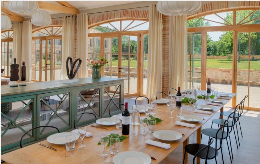
Crédit : Arcades salle à manger (CdeCambiaire La Bélonie - Halte en Cocagne_Marzens)