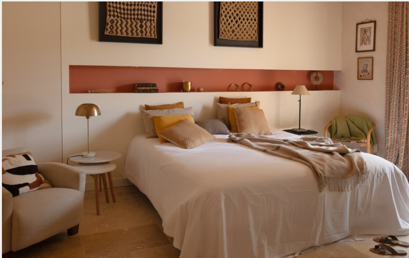
Crédit : chambre (CdeCambiaire Le Gîte L'Héritier - Halte en Cocagne_Marzens)