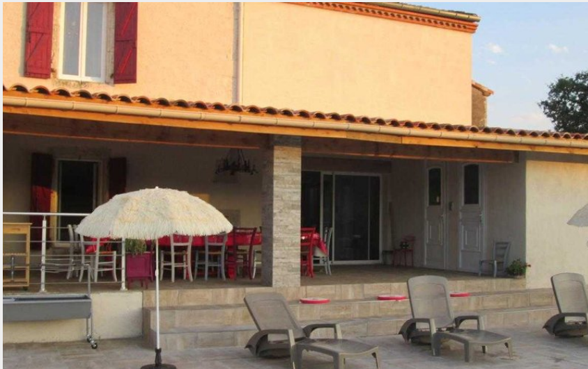
Crédit : Extérieur piscine