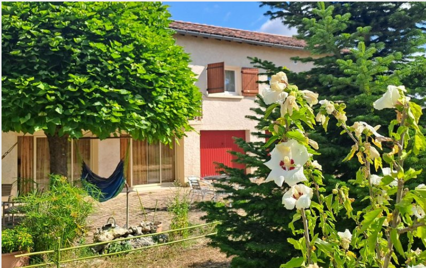
Crédit : Albi l'Escapade G1869 Gîtes de France Tam (ATTER Gîtes de France Tam)