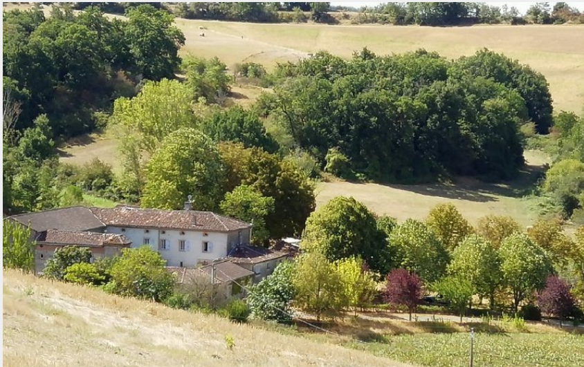
Crédit : vue extérieure (E.Delacroix - Maison Bosc Lebat - Massac-Séran)