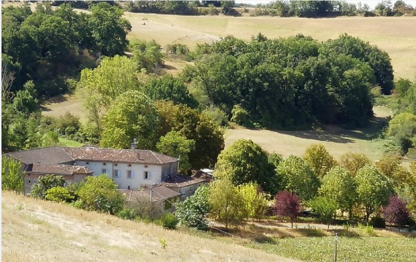
Crédit : vue extérieure (E.Delacroix - Maison Bosc Lebat - Massac-Séran)