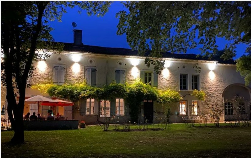
Crédit : extérieur de nuit (E.Delacroix - Maison Bosc Lebat - Massac-Séran)