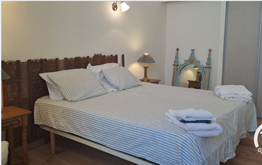
Crédit : Chambre 2 avec 2 lits en 90x200cm jumelable (ATTER Gîtes de France ©AlvesClaire)