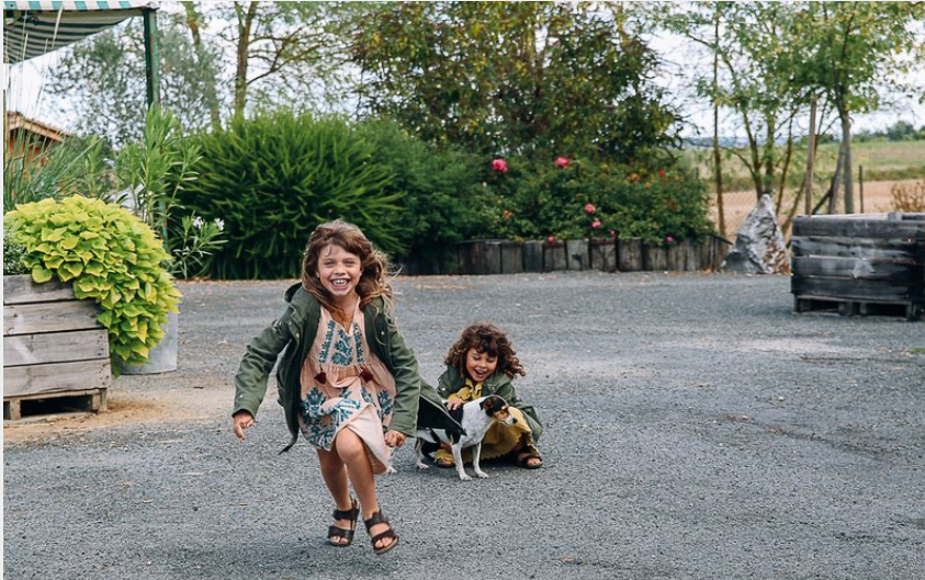
Crédit photo : Les jardins de Martine - saint-Sulpice - Tarn - 81 (edieucrea)