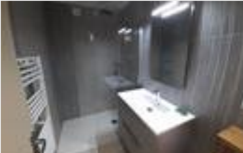
Crédit : Salle de bain