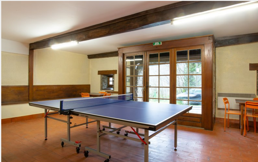
Crédit : G1765 - La Moulinquié - Saint-Cirgue (ATTER Gîtes de France Tarn)