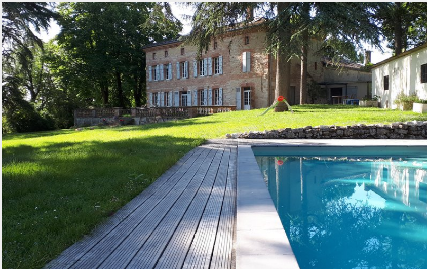
Crédit photo : piscine (S-Valette - Chambres d'Hôtes Le Jardin de Cèdres - Lavour)