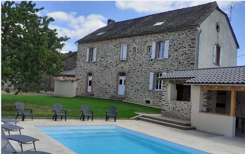
Crédit : le Sécadou Moularès Gîtes de France Tarn (ATTER Gîtes de France Tarn)