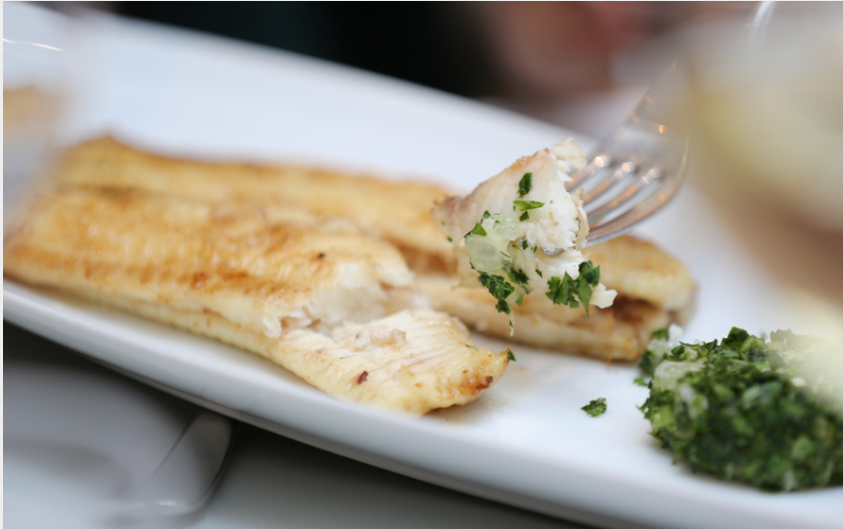
plat