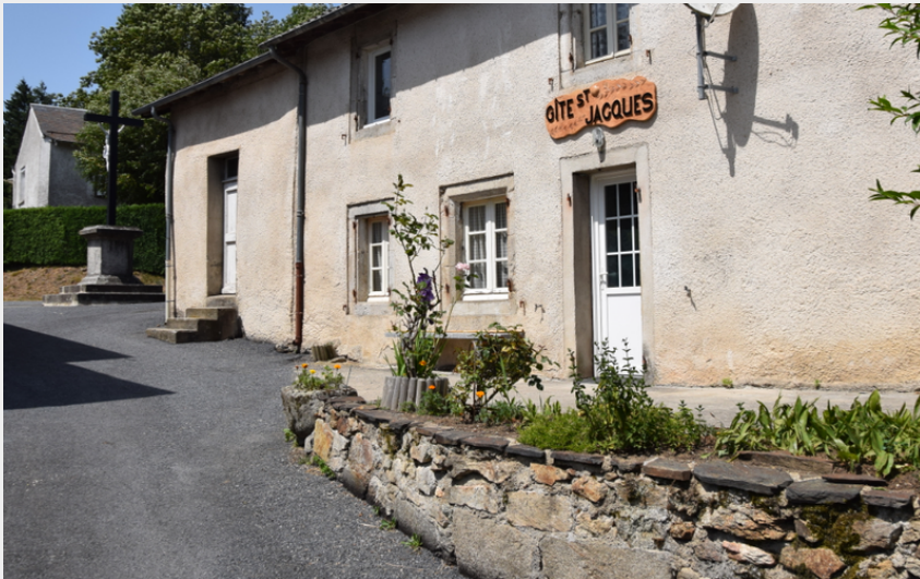
façade du Gite Bouisset Lasfaillades St Jacques