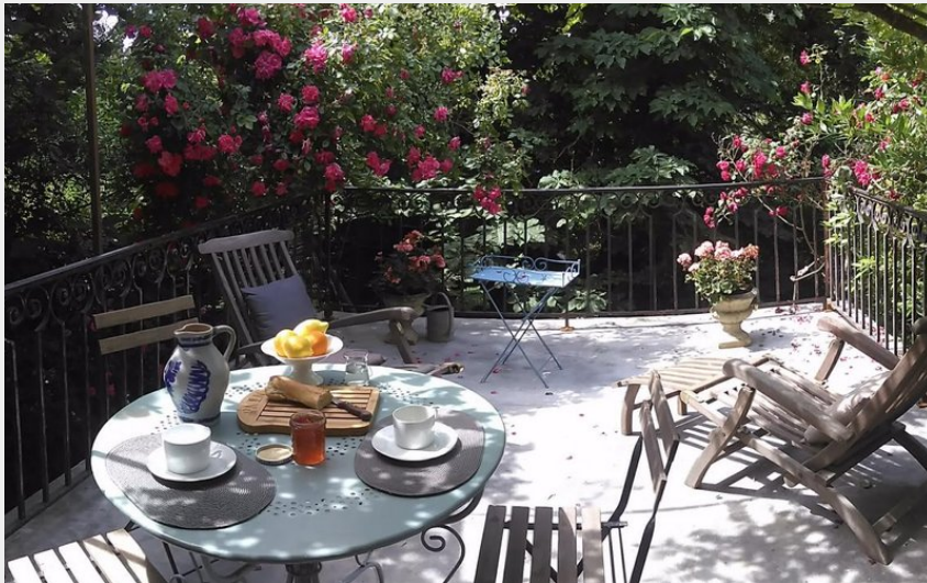
Crédit photo : terrasse (C.Langlois - Gîte de la Tour-Donjon - Belcastel - Tarn)