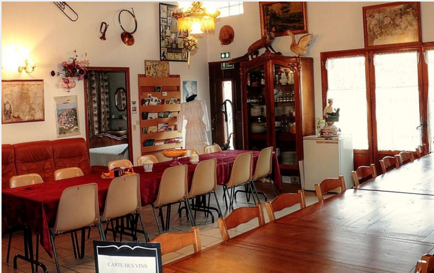
Crédit photo : Salle Petit Déjeuner et Repas Tables d'hôtes (Gîtes de France)