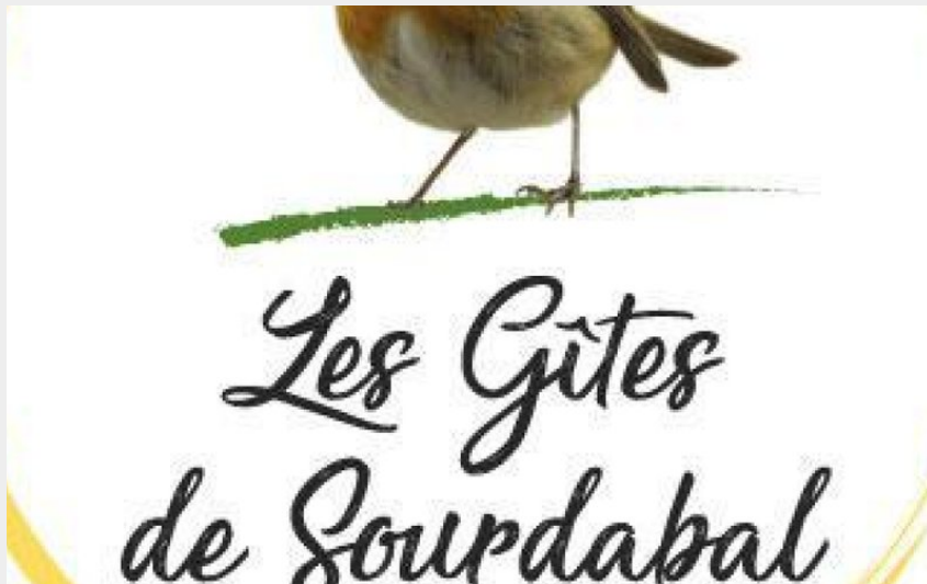
Crédit photo : Les Gites de Sourdababal vous accueillent toute l'année ! (Gîtes de France)