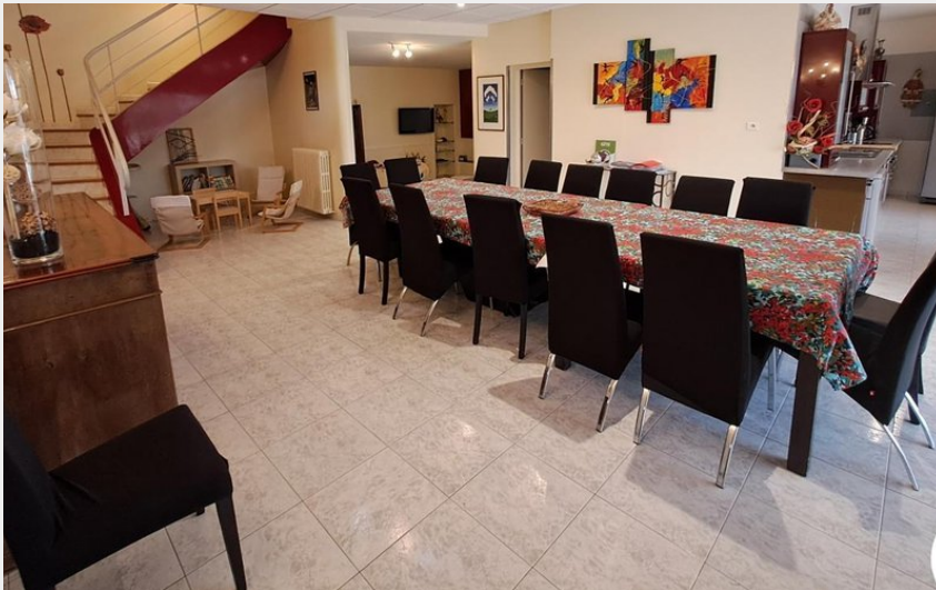
Crédit photo : La Roque - St Agnan - Gîtes de France Sud - pièce à vivre (Gîtes de France)