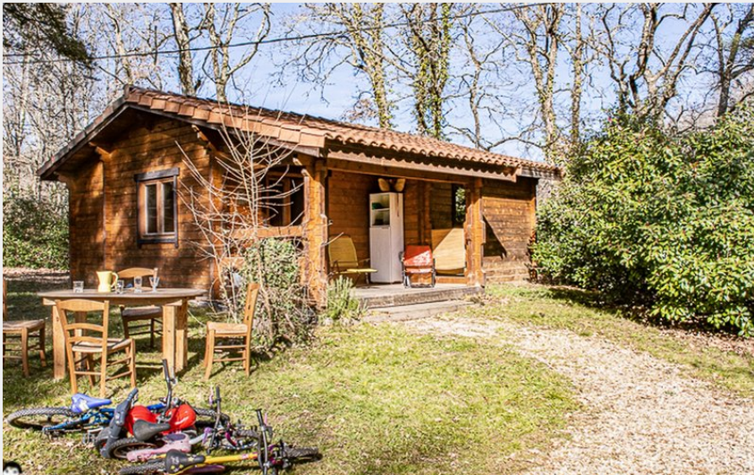
Crédit : chalet bois (Parc Résidentiel de Loisirs Les Fées du Moulin_Lisle-sur-Tarn)