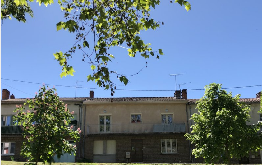
Crédit photo : Vue du Bâtiment ( https://www.residence-natura.com )