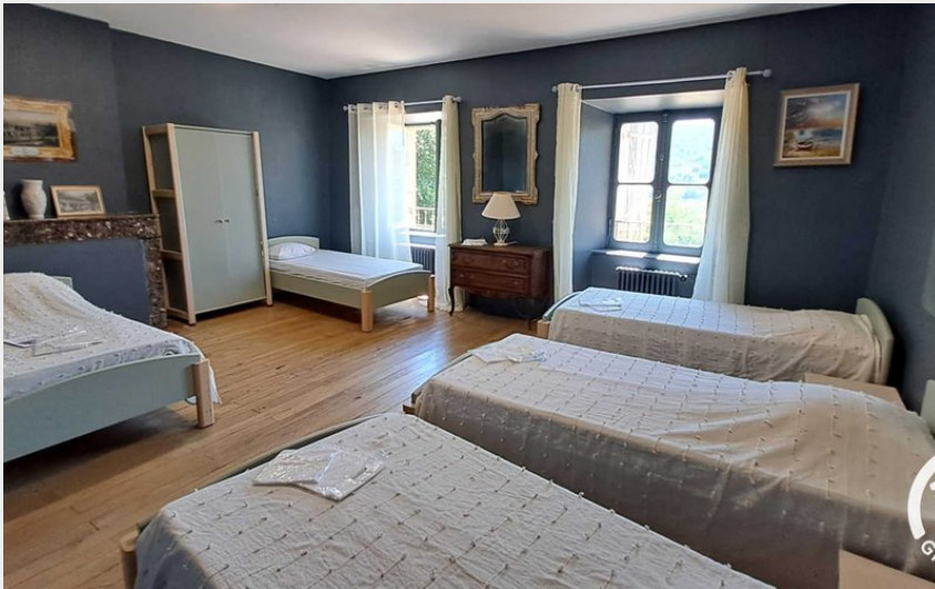
Crédit : Château de Calmels - Lacaune, Tarn - G5024 -Gîtes (Gîtes de France)