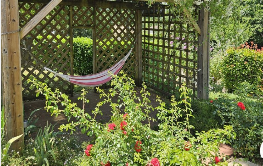
Crédit : La Brugue - Puygouzon - Gîtes de France - hamac (Gîtes de France)