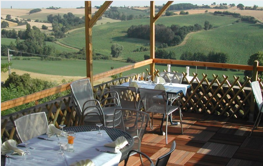
Crédit photo : Terrasse avec vue magnifique sur les coteaux (Restaurant Le relais des deux vallées)