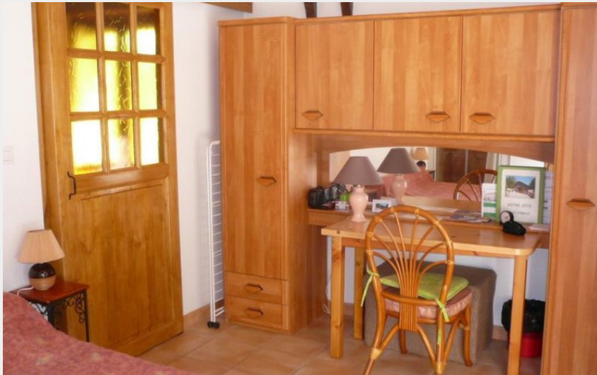
Crédit photo : Gîte La Vinelle G 1083 Fontrieu 81 13 (Gîtes de France)