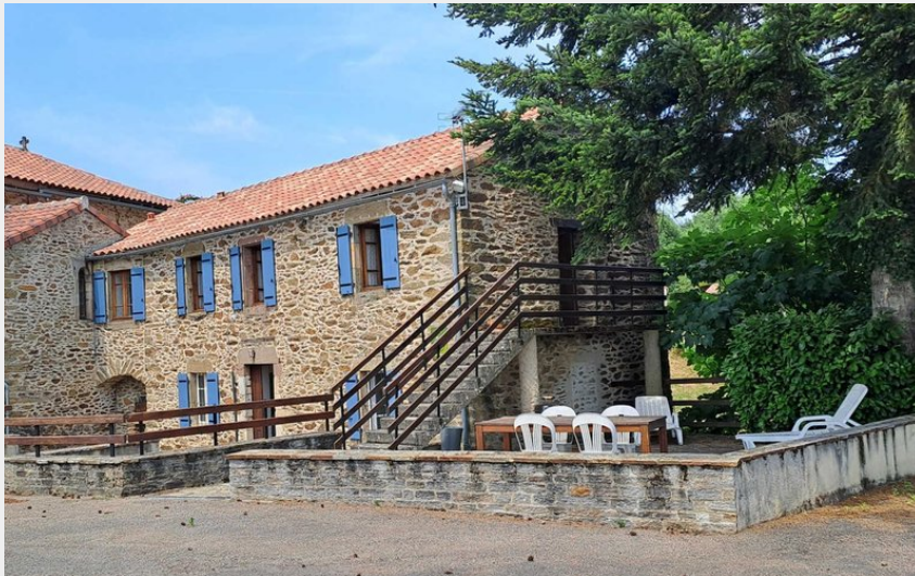
La Castagnal G713 - Jouqueviel - Extérieur